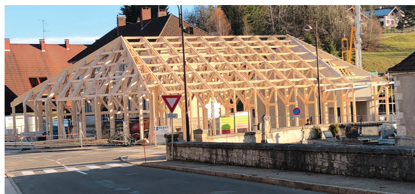
Halle couverte aux Hôpitaux-Neufs