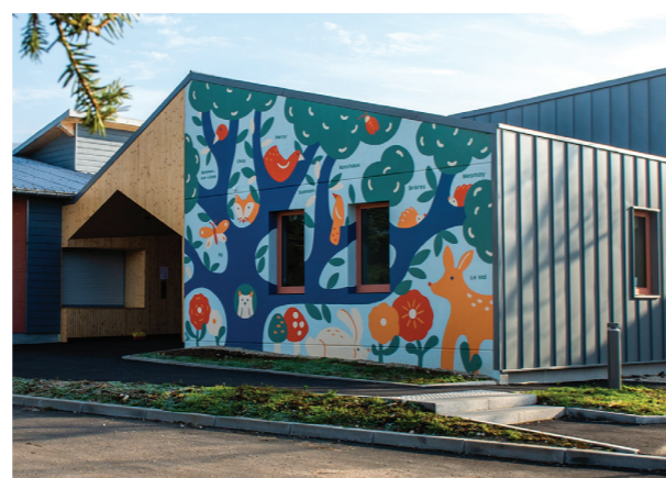
École de Chay - Fresque

Lorsqu'il existe un service effectué par une intercommunalité, les phases de programme et d'assistance pour le choix du maître d'œuvre ne sont pas éligibles au présent dispositif.